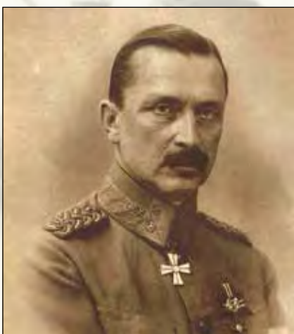
კარლ გუსტავ ემილ მანერჰაიმი (1867-1951) – გამოჩენილი ფინელი მხედართმთავარი. XIX საუკუნის დასაწყისიდან ფინეთი შედიოდა რუსეთის იმპერიაში და მხოლოდ 1917 წელს, რუსეთში მომხდარი რევოლუციის შედეგად მიიღო დამოუკიდებლობა. მანერჰაიმმა სამხედრო განათლება რუსულ სამხედრო სასწავლებელში მიიღო. იგი რუსეთის იმპერიის არმიაში მსახურობდა, სადაც გენერლობას მიაღწია. რუსეთ-იაპონიის (1903-1904) და პირველ მსოფლიო (1914-1918) ომებში ჯერ რუსეთის მხარეზე იომა, შემდეგ წინამძღოლობდა ფინელებს დამოუკიდებლობისათვის ომში 1918 წელს (რუსი ბოლშევიკების წინააღმდეგ), ფინეთ-საბჭოთა კავშირის ომსა (1939-1940) და მეორე მსოფლიო ომში, ასევე – საბჭოთა კავშირის წინააღმდეგ. მარშალი მანერჰაიმი თავისი პატარა ქვეყნის ეროვნული გმირია.

ჯარისკაცებო! მე ბევრგან მიბრძოლია, მაგრამ თქვენისთანა მამაც მეომრებს არსად შევხვედრივარ. თქვენით, როგორც საკუთარი შვილებით, ვამაყოფ, ქედს ვიხრი ფინეთის არმიისა და იმ ყველა სახის საჯარისო ნაწილის წინაშე, რომელიც ამ კეთილშობილურ მისიაში გამირულ საქმეებს სჩადიოდა ომის დაწყების პირველივე დღიდან. მადლობას ვუხდით მათ იმ სიმამაცისთვის, რომელიც უცნობი იარაღით აღჭურვილ და რიცხობრივად აღმატებულ მტერთან ბრძოლაში გამოავლინეს. მადლიერი ვარ, ასევე, მათი იმ შეუპოვრობისთვის, რომლითაც ისინი იცავდნენ მშობლიური მიწის ყოველ გოჯს. 1500-ზე მეტი რუსული ტანკისა და 700-ზე მეტი თვითმფრინავის განადგურება სწორედ იმ გამირულ საქმეებს მოწმობს, რომელთაც ხშირად ცალკეული ადამიანები სჩადიოდნენ. მეომრების სი-