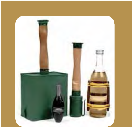
სახელწოდება „მოლოტოვის კოქტილი“ უკავშირდება ვიაჩესლავ მოლოტოვს. გავრცელებული ვერსიით, საბჭოთა კავშირი-ფინეთის ომის დროს მორიგი დაბომბვისას მოლოტოვმა თავის რადიოგამოსვლაში განაცხადა, რომ ისინი კი არ ბომბავდნენ ფინელებს, არამედ ამ ფორმით სურსათს აწვდიდნენ. ამის შემდეგ ფინელებმა საბჭოთა კასეტურ ბომბს PPAБ-3-ს მოლოტოვის პურის კალათა, ხოლო შედარებით მომცრო ზომის ბომბებს – მოლოტოვის საპურე. შემდეგ ფინელებმა საპასუხოდ გამოიგონეს ცხელი მასის ნარევი, რომელსაც თავდაპირველად ერქვა „კოქტილი მოლოტოვისათვის“ მოგვიანებით კი „მოლოტოვის კოქტილი“ შეერქვა.

მცირერიცხოვანი ფინური არმია გონივრული ტაქტიკისა და სიმამაცის ხარჯზე კარგა ხანს არა მხოლოდ აკავებდა აგრესორს, არამედ ცალკეულ ბრძოლებში შთამბეჭდავ გამარჯვებებს აღწევდა. კრემლში იგრძნეს, რომ ფინეთში გასეირნება არ გამოვიდა და დამატებითი ჯარები გააგზავნა