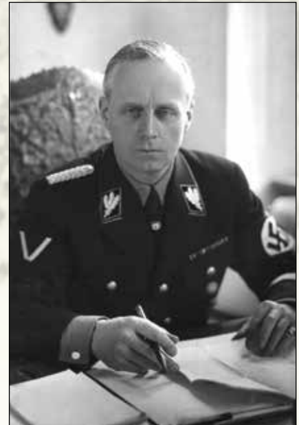
იოახიმ ფონ რიბენტროპი – ფაშისტური გერმანიის საგარეო საქმეთა მინისტრი.

1939 წლის აგვისტოში საბჭოთა კავშირი ყველასათვის მოულოდნელად დაუძმობილდა თავის იდეოლოგიურ მტერს – ფაშისტურ გერმანიას და ორივე ქვეყანამ ხელი მოაწერა ე.წ. მოლოტოვ-რიბენტროპის პაქტს, რომლის თანახმადაც, ორივე ქვეყანა უარს ამბობდა ერთმანეთს თავს დასხმობდა. სინამდვილეში, ამ ორ დიქტატურას შორის დაიდო შეთანხმება გერმანიასა და საბჭოთა კავშირს შორის აღმოსავლეთ ევროპის გაყოფის შესახებ, რაც აისახა მოლოტოვ-რიბენტროპის პაქტის საიდუმლო ნაწილში (პროტოკოლში). პოლონეთის აღმოსავლეთი ნაწილი, ბალტიის სამი ქვეყანა (ესტონეთი, ლატვია, ლიტვა) და რუმინეთის ნაწილი საბჭოთა კავშირს უნდა მიეღო, ხოლო პოლონეთის დასავლეთი ნაწილი – ფაშისტურ გერმანიას. პაქტის ხელმოწერიდან ერთი კვირის შემდეგ გერმანია, 1939 წლის 1 სექტემბერს, შეიჭრა პოლონეთში, ხოლო 17 სექტემბერს იგივე გააკეთა კომუნისტურმა საბჭოთა კავშირმა. პოლონეთის მოსპობის შემდეგ დადგა ბალტიის ქვეყნების ჯერი. საბჭოთა მთავრობა დაემუქრა ამ პანია ქვეყნების მთავრობებს და აიძულა ისინი დათანხმებულიყვნენ მათ მიწა-წყალზე საბჭოთა ჯარების შეყვანაზე. ამის შედეგად მოხდა საბჭოთა კავშირის მიერ მათი ოკუპაცია. რუმინეთს წაართვეს ბუკოვინა და ბესარა-