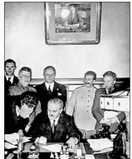
1939 წლის მოლოტოვ-რიბენტროპის პაქტის ხელმოწერა.

ამ მძიმე ომში ფინელებმა 26 ათასი მეომარი დაკარგეს, ხოლო დაახლოებით 40 ათასი დაიჭრა ან დასახიჩრდა. საბჭოთა კავშირის დანაკარგი ბევრად მეტი იყო: 140 ათასი მოკლული, დაახლოებით 300 ათასი დაჭრილი და დასახიჩრებული. საბჭოთა კავშირმა 2300 ტანკი და ჯავშნიანი