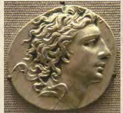
მითრიდატე ჰონტოელი – მითრიდატე VI ევპატორი დიონისე (Mithridates Eupator Dionysos) (ძვ. წ. 132-63) — პონტოს მეფე ძვ. წ. 121 წ-დან (ფაქტობრივად, ძვ. წ. 111 წ-დან). მემკვიდრეობით მიღებული მცირე სამეფო გააფართოვა: შემოიერთა მცირე არმენია, დაიპყრო კოლხეთი, ბოსფორის სამეფო და ყირიმის ბერძნული ქალაქები; ცდილობდა მთელი შავიზღვისპირეთის ერთ სახელმწიფოდ გაერთიანებას და აზიიდან რომაელთა განდევნის მიზნით კავშირი შეკრა შავი ზღვის დასავლეთ სანაპიროს ბერძნულ ქალაქ-სახელმწიფოებთან; გარკვეული დროით კაბადოკია და ბითინიაც შემოიერთა. მითრიდატე VI იყო ენერგიული, ფიზიკურად ძლიერი განათლებული პიროვნება, ნიჭიერი მხედართმთავარი და პოლიტიკოსი, ძალზე მკაცრი და შეუბრალებელი.

რომს საკუთარი პოლიტიკური მიზნების განსახორციელებლად აზიაში თავისი სამხედრო და დიპლომატიური შესაძლებლობების სრულად გამოყენება უხდებოდა, რამდენადაც ძალა უნდა ეჩვენებინა როგორც ჯერ კიდევ ალექსანდრე მაკედონელის მიმდევართა მიერ შექმნილი ელინისტური სახელმწიფოების ამბიციური მმართველებისათვის, იმპერიული