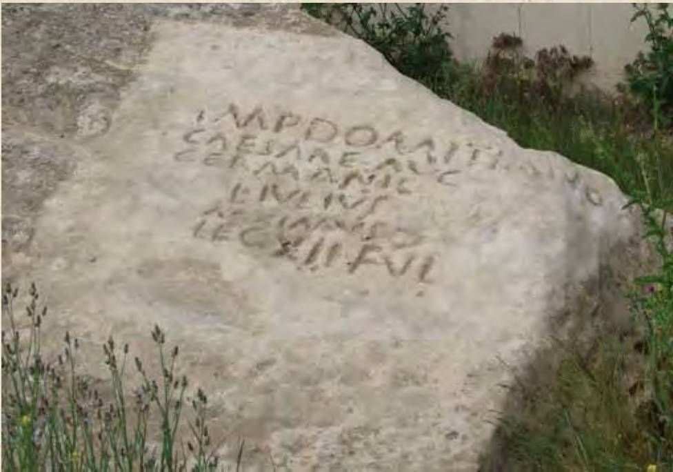
აზერბაიჯანში აღმოჩენილი წარწერა, სადაც მოხსენიებულია კეისარი ავგუსტუსი და Legio XII Fulminata.

მცირე აზიაში და მათი ტრაგიკული მარცხი, ისტორიის ასპარეზზე ოქტავიანე ავგუსტუსის გამოსვლა და პრინციპატის ერის დაწყება) და ყოველივეს დაგვირგვინებით Imperium Romanum-ის – რომის იმპერიის – შექმნით, რამაც მსოფლიოში ახალი პოლიტიკური რეალობა წარმოქმნა.