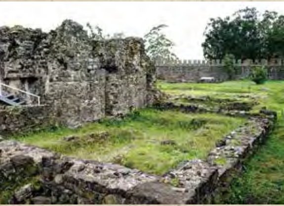
რომაული აბანოს ნანგრევები, გონიო

აგათიასი, იგივე აგათია სქოლასტიკოსი (გატჰიას შცჰოლასტიკოს) (დაახლ. 536-582) – ბიზანტიელი პოეტი და ისტორიკოსი. მისი მთავარი თხზულებაა „იუსტინიანეს მეფობისათვის“, სადაც ავტორი ქრონოლოგიური თანმიმდევრობით გადმოგვცემს ბიზანტიის იმპერიის 552-558 წწ-ის ამბებს და VI ს-ის დას. საქართველოს – ლაზიკის – ისტორიის ძირითადი წყაროა.