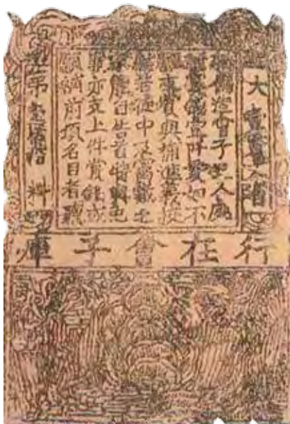
უძველესი ჩინური ბანკნოტი, სამხრეთ სუნის დინასტიის, 1160 წ.

ფული წარმოადგენს საშუალებას, რომლითაც ადამიანები მათთვის სასურველ საქონელს და მომსახურებას იძენენ. დავუშვათ, რომ გსურთ კომპიუტერის შეძენა ან შეკეთება, ამ საქონლის (კომპიუტერი) და მომსახურების (კომპიუტერის შეკეთება) მისაღებად თქვენ გამყიდველს (შემკეთებელს) უნდა გადაუხადოთ გარკვეული თანხა, წინააღმდეგ შემთხვევაში, თქვენ მათ ვერ მიიღებთ. ამ დროს ფული გაცვლის საშუალების ფუნქციას ასრულებს : გამყიდველი თავისი საქონლის (მომსახურების) სანაცვლოდ იღებს ფულს.